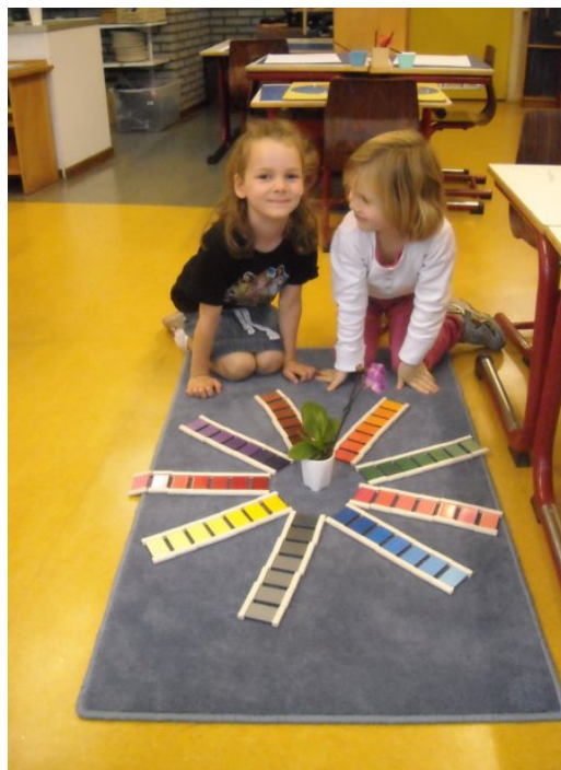
Trots op het werken met de kleurspoelen