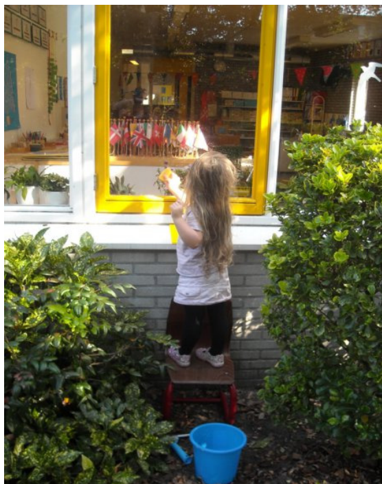
Lesje ramen wassen in de onderbouw

Wij wensen allen een fijne herfstvakantie toe!