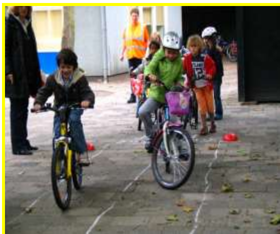
en de praktische verkeerslessen.