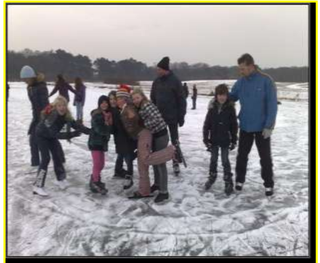
Schaatsen tijdens de gymles