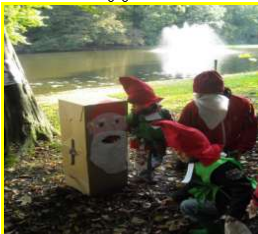
De jaarlijkse herfsttocht voor de kleuters

Toelating tot de brugklas gebeurt op basis van advies van de basisschool en de uitslag van de Cito-toets. Met de scholen voor voortgezet onderwijs wordt nauw overleg gepleegd over de plaatsing van de kinderen. Bezoeken van schoolleiders over en weer vinden doorgaans twee keer per schooljaar plaats. Plaatsing in een specifieke brugklas (havo/vwo of bijvoorbeeld mavo/havo) hangt af van de combinatie van advies- en toetsgegevens.