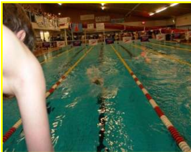
Zwemtoernooi Wassenaarse scholen

Het protocol ligt op onze school ter inzage.